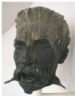
J. F. Willumsens portrætbuste af Viggo Hørup (Willumsenmuseet i Frederiksværk,)

Den politiske kamp mellem Højre og Venstre handlede om forfatning og forsvar. Men striden greb om sig og medførte brydninger i alliancen mellem grundtvigianerne, "det litterære venstre" og socialdemokraterne.