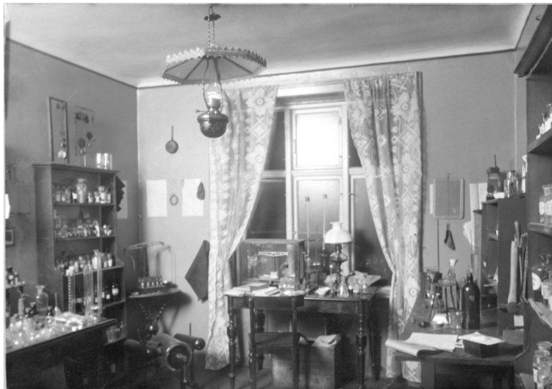
Kemisk oplysningskontor for Haandværkeres Laboratorium, Gothersgade 167 III