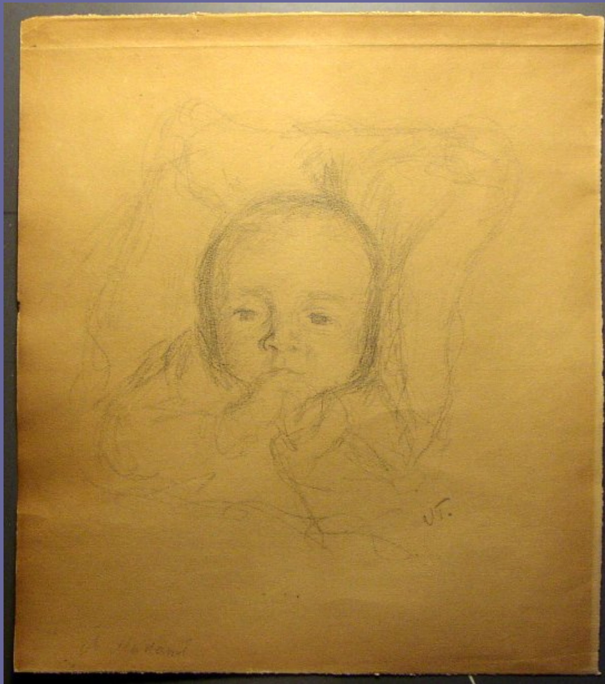
Vilhelm Tetens tegnede Elisa 1915