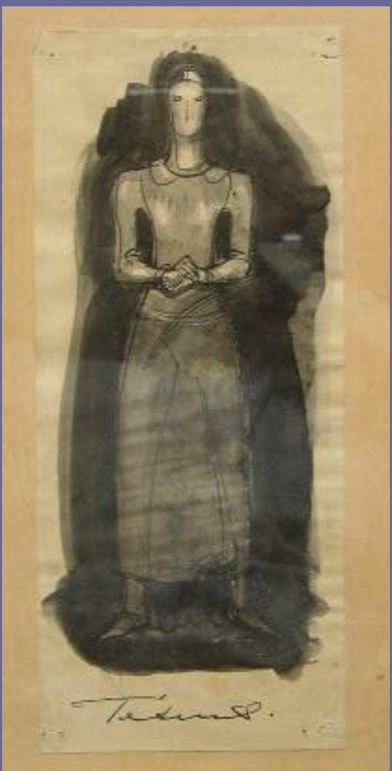
Karikatur udført af Einar Utzon-Franck, 1935